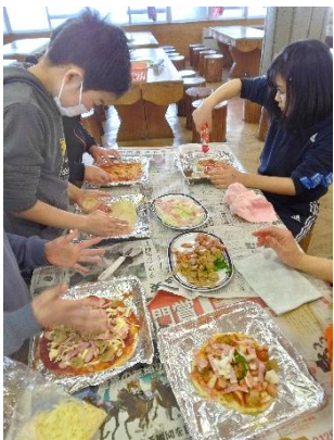
〔一斗缶ピザづくり〕