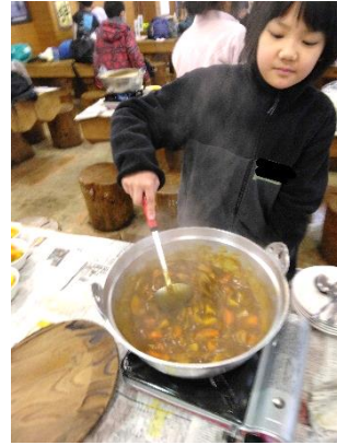
〔ポークカレー作り〕